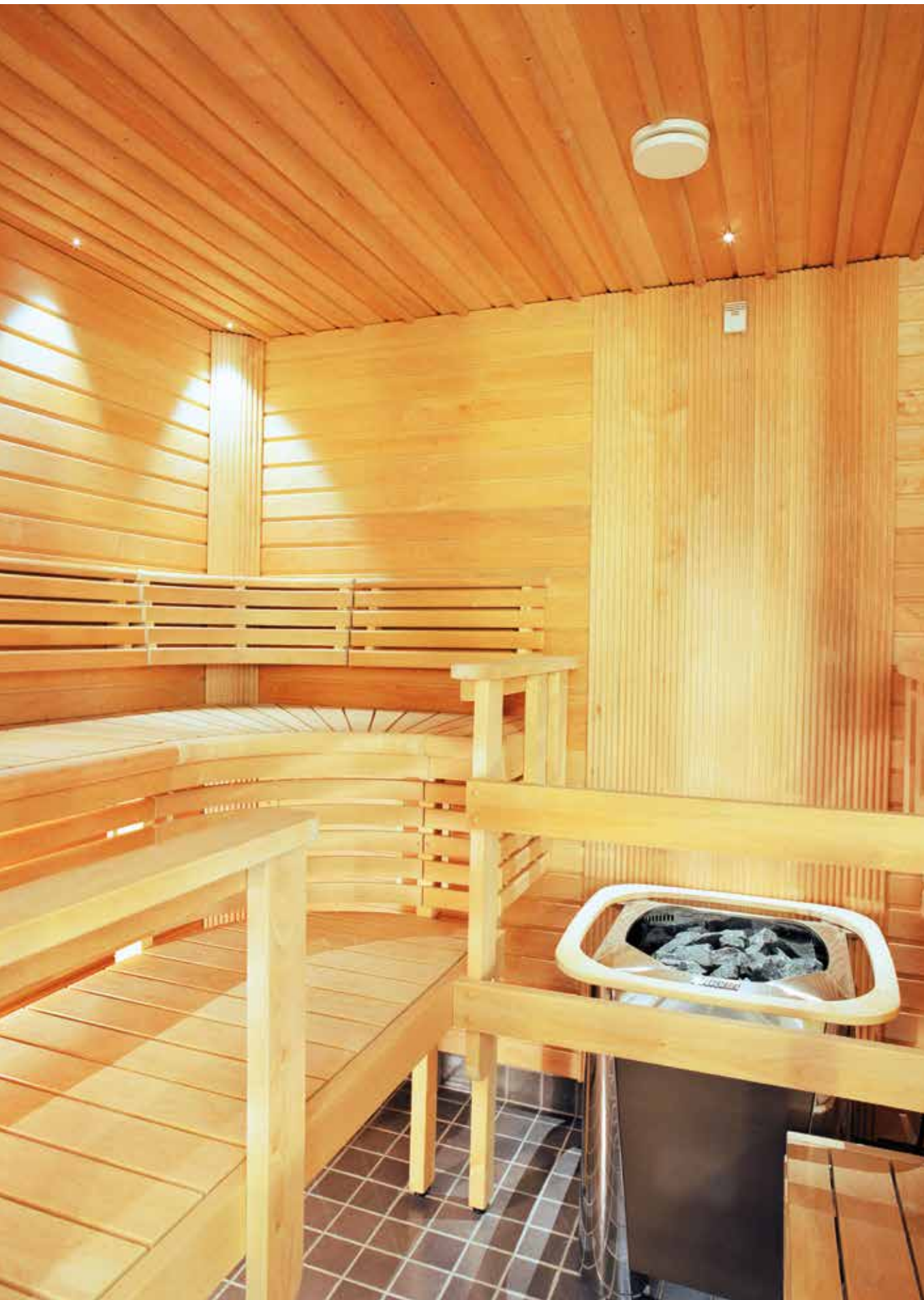
Mestan tuotantoa, rakentaja Mesta Kodit Oy