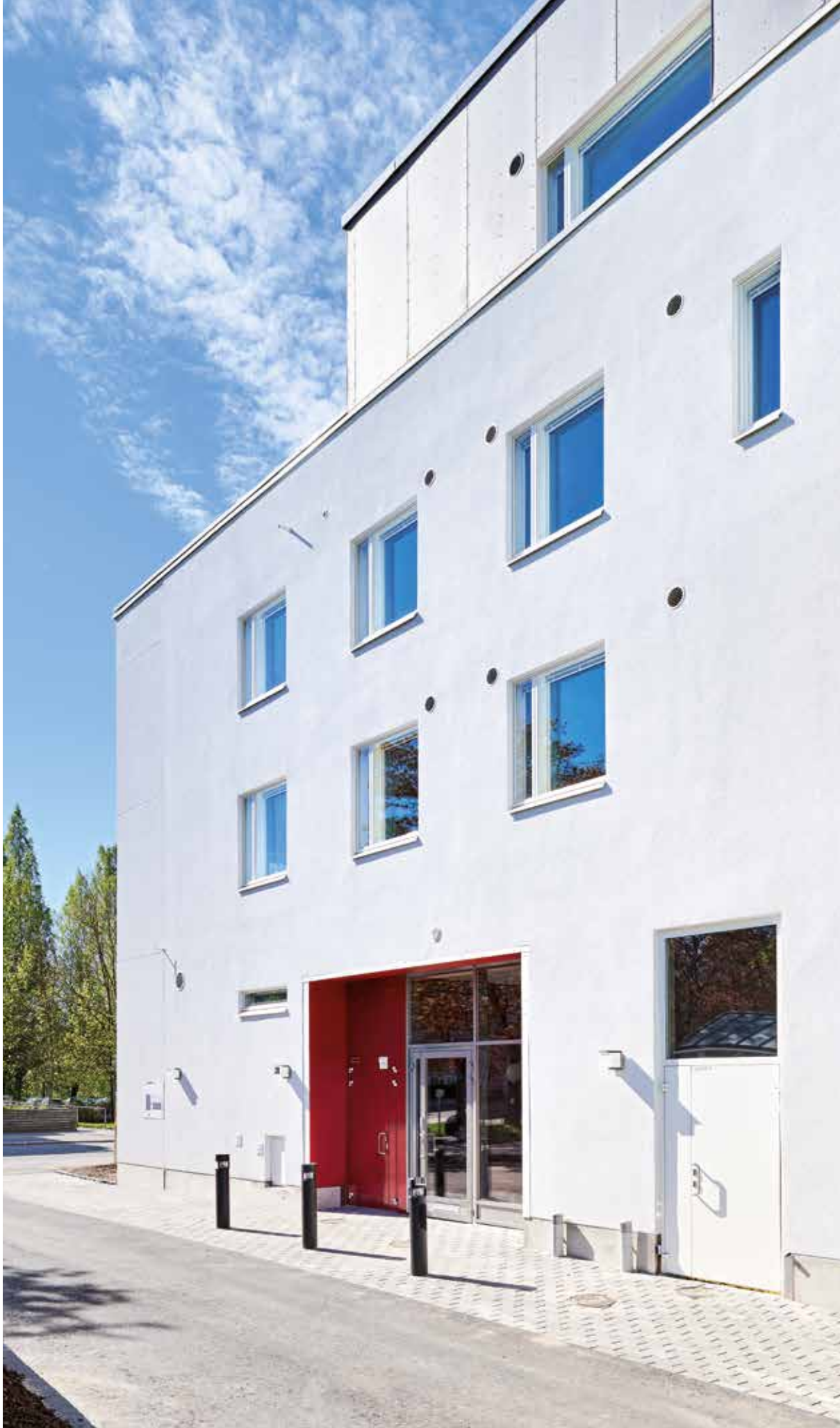
(As Oy Mäkitorpanie 30, Lapti Oy)