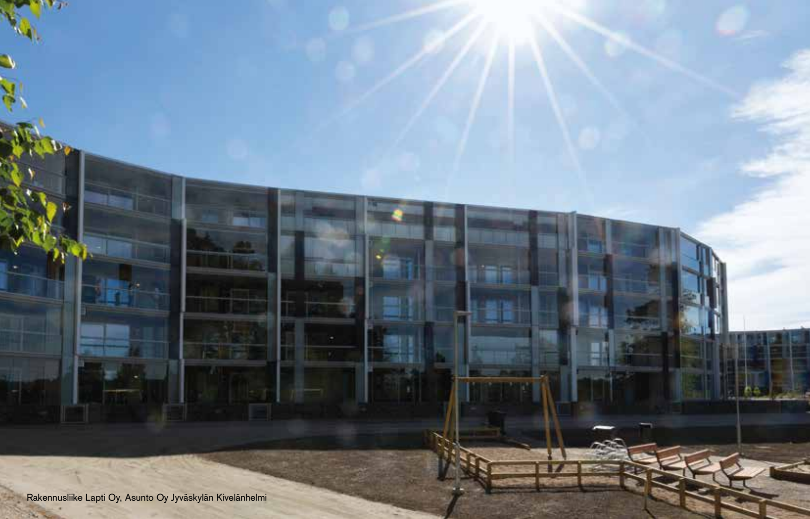
Rakennusliike Lapti Oy, Asunto Oy Jyväskylän Kivelänhelmi